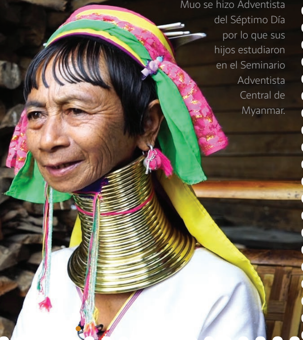
Muo se hizo Adventista del Séptimo Día por lo que sus hijos estudiaron en el Seminario Adventista Central de Myanmar.